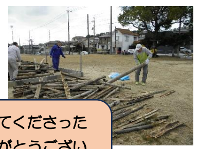
お手伝いしてくださった皆様、ありがとうございました!