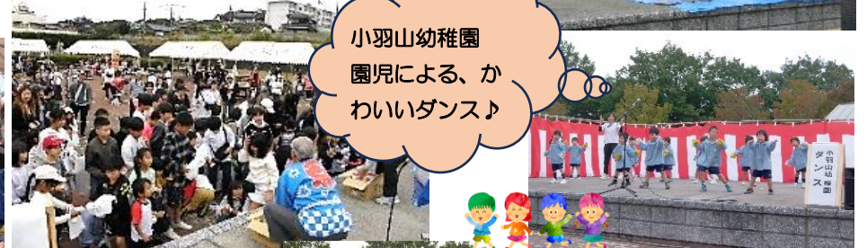
小羽山幼稚園 園児による、か わいいダンス♪