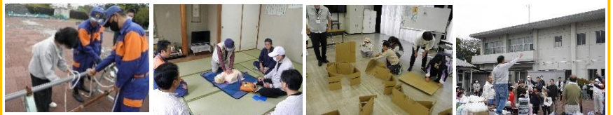
【小羽山地区自主防災会】

事故や災害は、いつ何時起こるか分からないので、日頃から訓練しておく、いざという時に役立ちます。