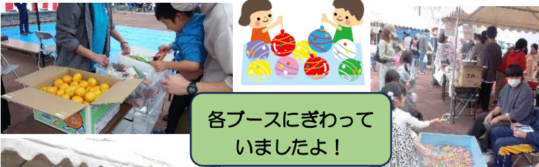
各ブースにぎわって いましたよ！