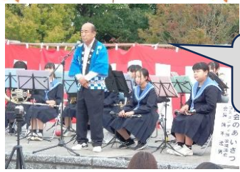
コミュニティ推進協議会 婦木会長挨拶