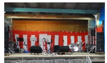
生バンドで演奏会