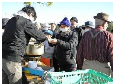
豚汁いただきまーす!