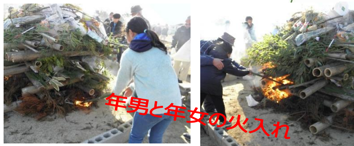
年男と年女の火入れ

ぜんざい、豚汁の振る舞いがあり、目玉のお楽しみお年玉が当たるビンゴゲーム大会には 250人余りの参加者で大いに盛り上がりました。