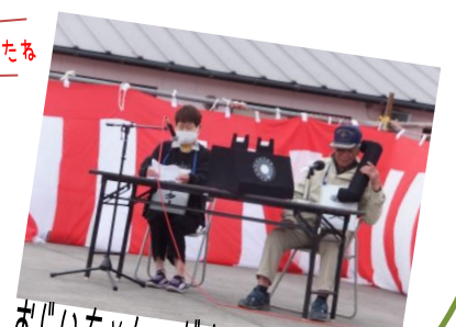
おじいちゃん、だまされてるよ!