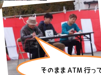
そのまま ATM 行って!