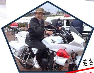
若さでは負けません!