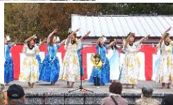
小さな男の子、フラ頑張りましたね