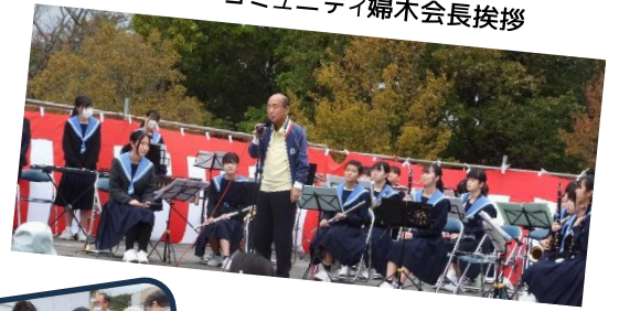
コミュニティ婦木会長挨拶

久しぶりのふるさとまつりが開催されました。作品展・演芸と保育園児から中学生の吹奏楽、よさこい、カラオケ、フラダンス、銭太鼓と大変盛り上がりました。たくさんの方のご協力で盛会裏に終わることができ、本当にありがとうございました。そして、皆さまお疲れ様でした。