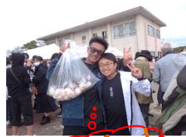
みんな、がんばりました!