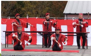
華麗なるバチさばき