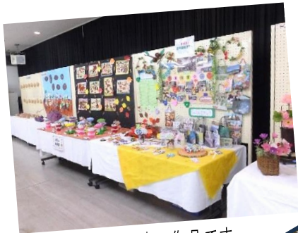
子ども達の作品です