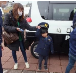
ママ、ぼくおまわりさんになる!